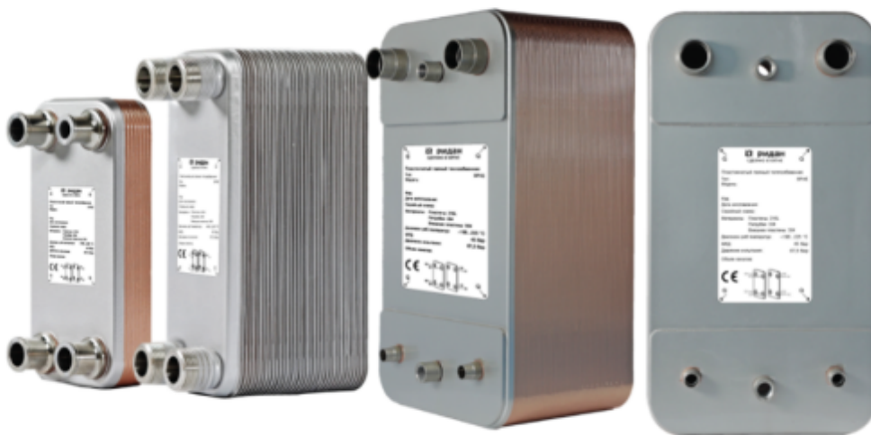
Рис.1 - Внешний вид теплообменников пластинчатых типа ВРНЕ

Теплообменники пластинчатые типа ВРНЕ предназначены для передачи тепловой энергии от одного теплоносителя к другому. Теплообменники пластинчатые типа ВРНЕ могут применяться в холодильных установках (компрессорных, абсорбционных), а также в тепловых насосах. В качестве рабочих сред могут использоваться негорючие хладагенты (фторуглероды, хлорфторуглероды, аммиак, CO 2 ), технические и холодильные масла, вода для технических нужд и систем ГВС, спиртосодержащие растворы.