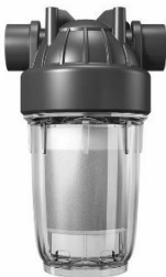
арт. 750 001